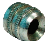
Art. 5996 Puntalino svasato M10x1