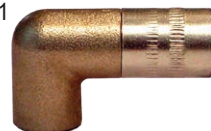
Art. 5980 Testina a 4 griffe 90° M10x1