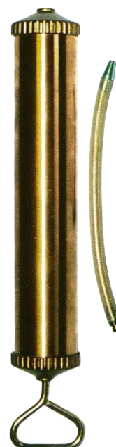
Art. 14010 Con terminale flessibile