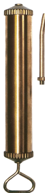
Art. 14310 Con terminale rigido

Siringhe aspirante-premente per olio cambio differenziale, corpo in ottone capacità 1000 gr.