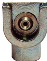
Art. 5990 Testina a spinta TE 15 mm M10x1