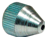
Art. 5998 Puntalino conico M10x1