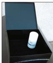
vano scola filtri