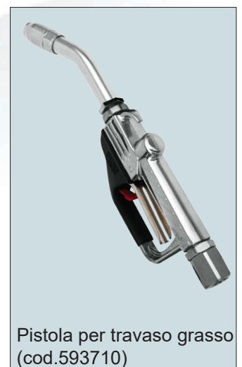
Pistola per travaso grasso (cod.593710)