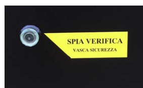
Spia verifica vasca sicurezza