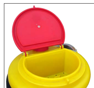
boccaporto con scola filtri