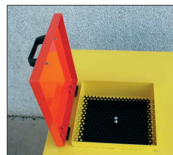
Vano scola filtri